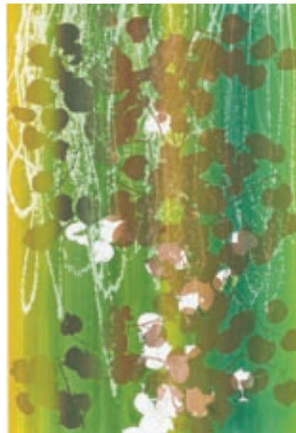
Reinoud van Vught