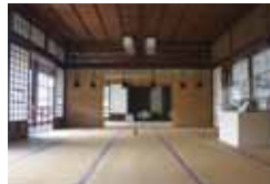
△ 臨江閣本館2階 △ 臨江閣本館1階