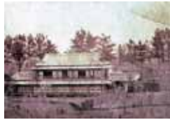
△ 明治24年撮影 臨江閣本館全景