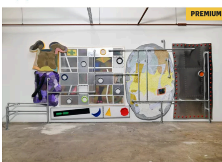
▲ Een installatie op de expositie Great Primer gemaakt door Cas van Deurssen.