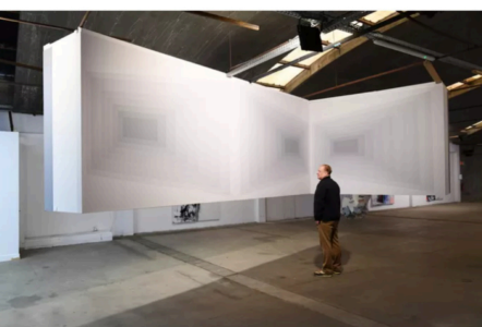
▲ De enorme omvang maakt van de werken een beleving.

Wie verder op ontdekkingsstocht wil kan de expositie Great Primer nog bezoeken tot en met 1 september. MOYA (Wilhelminakanaal Zuid 104 in Oosterhout) is geopend van vrijdag tot en met zondag van 11.00 tot 17.00 uur.