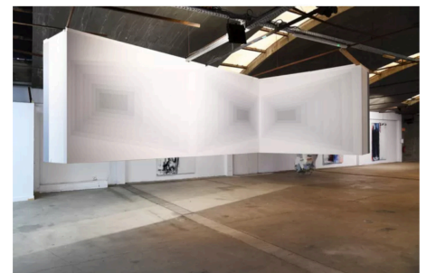
▲ Een imposante installatie van Linda Arts.

Tekst gaat verder onder de foto: een ode aan het grillig golvende zeewater.